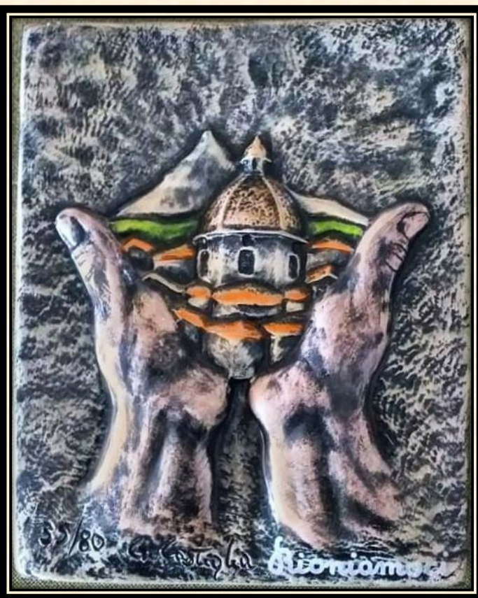
SIMBOLO DI RIONIAMOCI CONSEGNATO A TUTTI I PARTECIPANTI