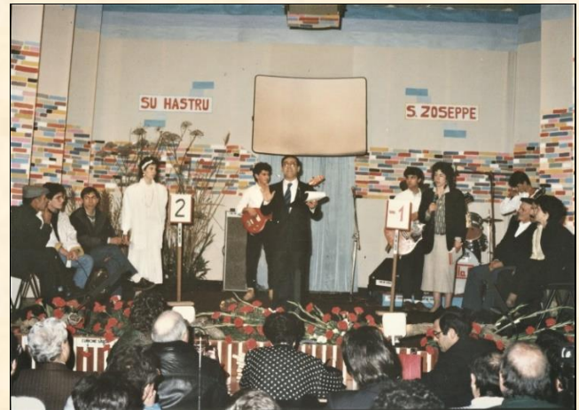
IMMAGINI DELLE DUE EDIZIONI, A SINISTRA 1982, A DESTRA EDIZIONE 1987