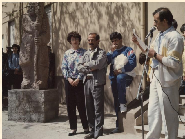
FOTO DI GRUPPO ULTIMA SERATA 1987 - E GIORNO DELLA SISTEMAZIONE DELLA STATUA DI PINUCCIO SCIOLA (Aprile 1987 - dono de L'Unione Sarda al rione vincitore)

Clicca per tutte le foto e rassegna stampa di RIONIAMOCI 1982