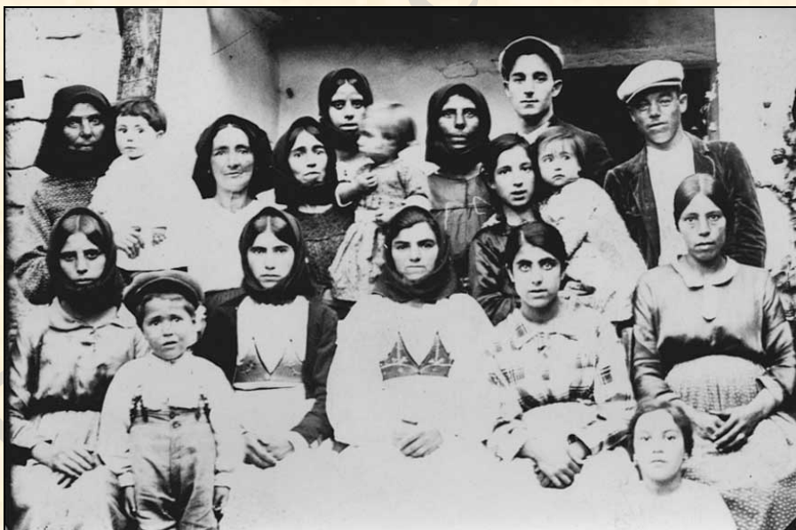
Abitanti del rione "Humbentu" (foto 1932-33)

Item declara que su madre durante su vida no sea perturbada de vivir en las casas que presente habita por ser su voluntad.