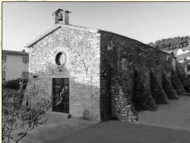
Foto a sinistra (di M.Leopold Wagner 1905-6) la Chiesa di Su Carmu (N.S. del Carmelo), nella parte a destra si scorge il convento; le costruzioni erano circondate da alte mura. Nella foto a destra Chiesa de Su Carmu anni '90. Alla destra di questa chiesa sorgeva il "Conservatorio", dai mamoiadini chiamato Humbentu del quale non vi è più nessuna traccia.

Non può bensì l'infrascritto prescindere di riflettere, che invano si spererebbe l'accennato vantaggio se nell'istituzione della pia opera non si prendessero tutte le misure necessarie, non solo per liberare il ritiro da qualunque insulto che potesse presentarsi da malviventi, trattandosi di un Paese aperto e di montagna qual è Mamojada, e per assicurare l'amministrazione dei beni ed il miglioramento dei medesimi; ma altresì per istabilire le regole necessarie da ascriversi per la conservazione del buon ordine e singolare l'esclusione dell'ingresso a qualunque persona d'uno ed altro sesso che non ci si rechi per esser educata ed istruita.