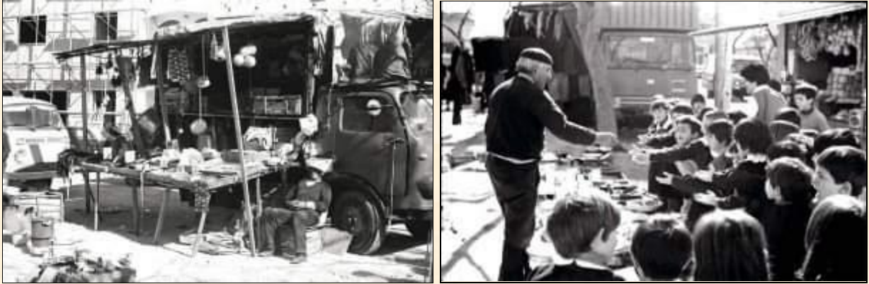
“S’ira ‘e Deus” ritratto da Claudio Gualà

Abbiamo trovato due scatti del compianto Claudio Gualà, storico fotografo della “Nuova Sardegna”: sono foto di metà anni ’70, una ritrae s’ira ‘e Deu mentre si riposa ...sotto l’ombra del ‘grande giornale’; l’altra mentre dona compiaciuto dei palloncini ad una intera classe elementare.