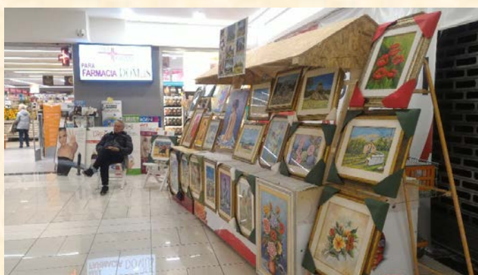
Presentazioni e mostre in Italia