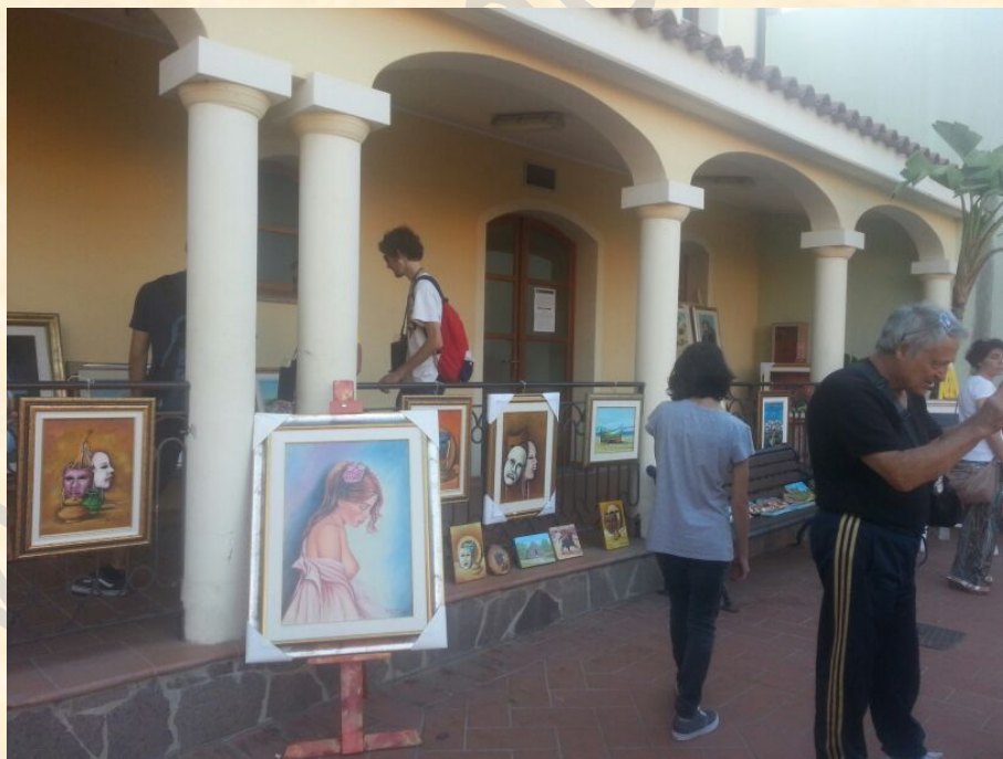
Mostra a Siviglia (Spagna)