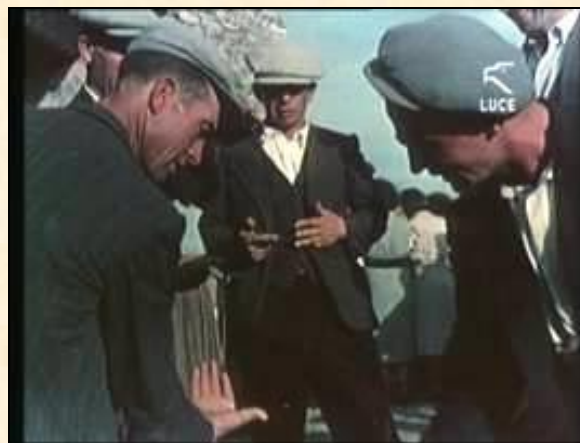
Il gioco della morra nel santuario SS. Cosma e Damiano - Mamoiada

Nelle grandi sfide normalmente la coppia dei giocatori è affiatata e ambedue sono abili, ma qualche volta capita che ad essere in forma è uno solo, vuoi perché ha individuato la semplicità del gioco degli avversari, oppure perché gli stessi hanno schemi abbastanza intuibili, o semplicemente perché è in “stato di grazia”. Ragion per cui il murrèri “cede la mano” al proprio compagno facendosi prendere il punto facilmente dall'avversario e lasciare così campo libero all'amico che ha ritmo e concentrazione maggiore ( sa murrà la juhes tue... la morra è tua, cioè oggi sei imbattibile, vai... ).