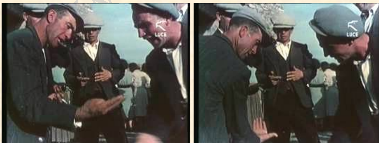
Il gioco della morra nel santuario SS. Cosma e Damiano - Mamoiada (foto Istit. Luce anni '50)

Quando qualcuno bara è motivo di dissapori e talvolta piccole rissa fra partecipanti.