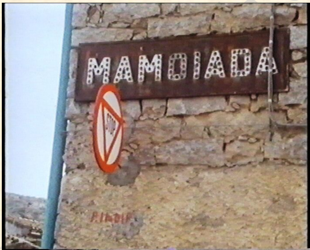
Cartello stradale ingresso paese sino agli anni '60

Attualmente a Mamoiada sa mùrra viene praticata in occasione di matrimoni e rebòttas (spuntini), maggiormente in occasione della festa dei SS. Cosimo e Damiano, nel cortile del santuario, spesso si protrae fino alle ore piccole, superando il freddo della notte con il... riscaldamento “ad alcol” ( vinu nigheddu e abbardènte ).