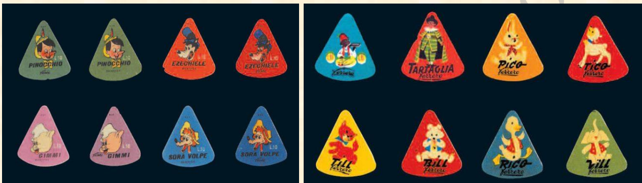
Le figurine attaccate all'esterno della stagnola sui cioccolati "lupetto"

Il lupetto era un 'triangolo' di cioccolato con amalgama di nocciole tritate, rivestito con carta stagnola dorata (pareva un formaggin) e aveva l'immagine, sempre triangolare di personaggi della Disney ed altri tipici cartoni, incollata sull'esterno di ogni singola confezione. Una vera squisitezza, il tipico sapore fu riportato poi nella nota "moderna" Nutella , ma senza i piccoli 'granelli' delle nocciole.