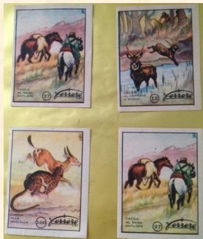
figurine sulla caccia