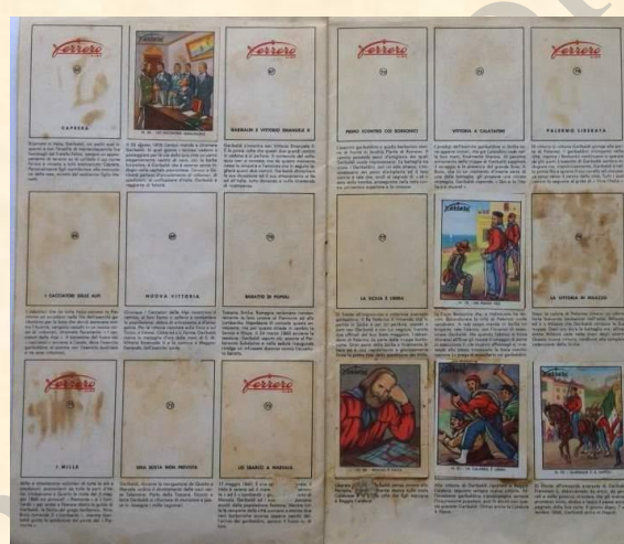
Album "Epopea Garibaldina"

Fra ragazzini si giocava a figurine e si scambiavano quelle doppie, si era ossessionati da quelle solite che si trovavano in continuazione. Occorrevano ben 100 figurine per completare l'album e poter avere un premio dalla ditta, quindi i soldi donati, vinti al gioco o...rubacchiati, venivano investiti principalmente in moni e lupetto . Dei veri azionisti Ferrero.