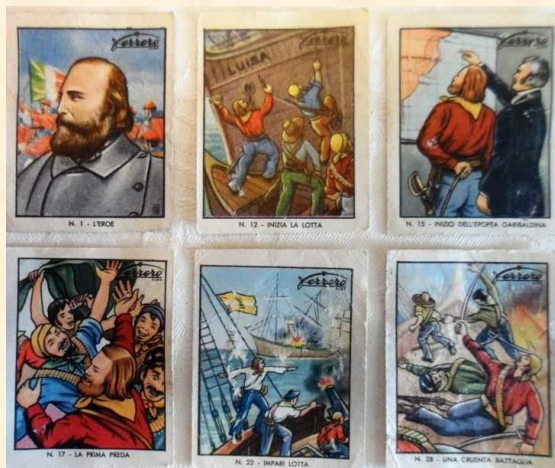
Figurine sulle gesta di Garibaldi